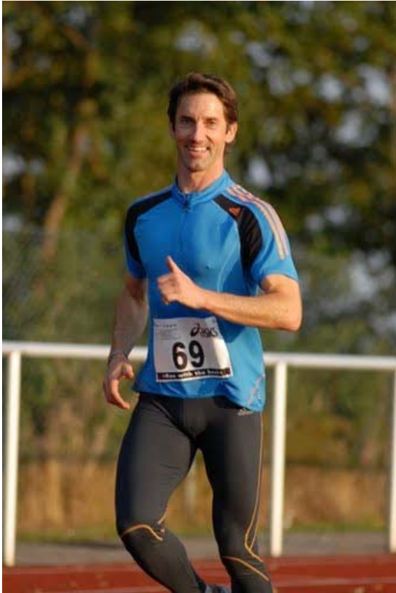
Abb. 9: Spass okay, aber so wird das nix...

Video & mehr demnächst unter: http://www.paulguckelsberger.de/sport-stories.htm