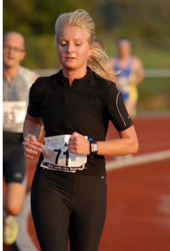
Abb. 14: .... zu früh lachen rächt sich !