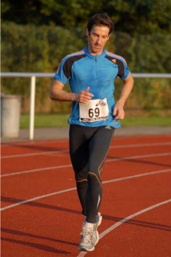
Abb. 13: Siehst Du, zu früh lachen rächt sich !

Video & mehr demnächst unter: http://www.paulguckelsberger.de/sport-stories.htm