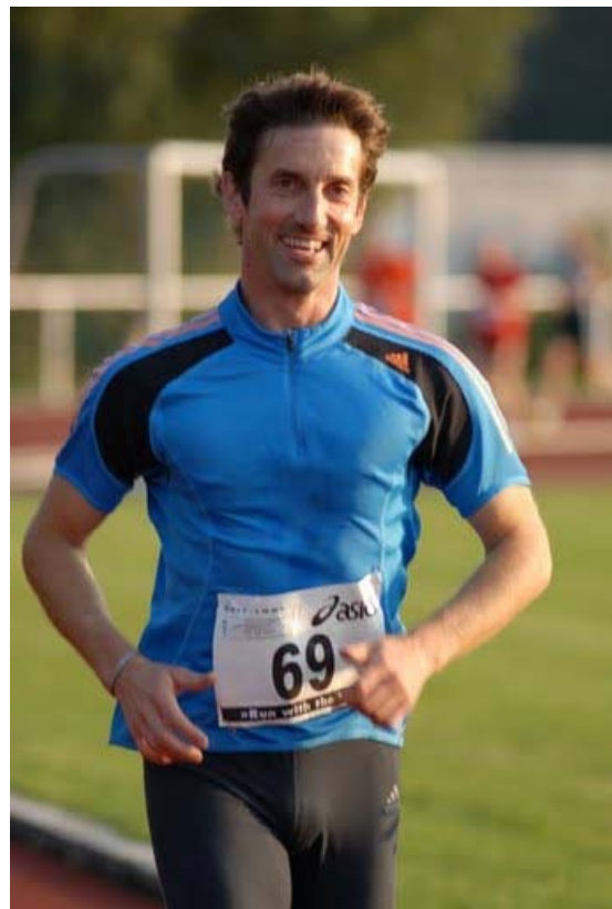
Abb. 12: Nee, das rächt sich ....