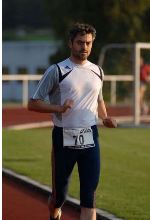
Abb. 10: Da sieht das schon siegreicher aus..