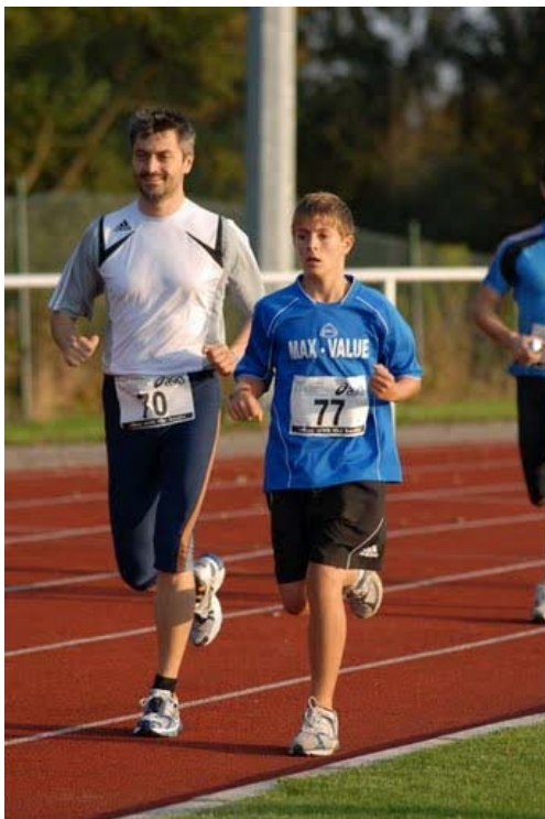
Abb. 3: Kein Zweifel, das wird Calvins Tag... Stunde !