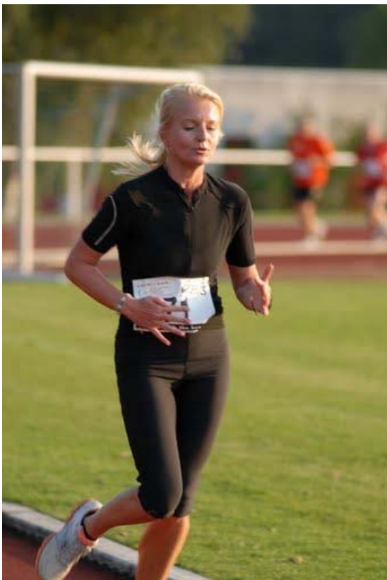
Abb. 11: .... und wichtig ist, dass die Fingerzwischenräume stets gut belüftet werden ;o)